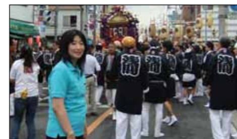
「第54回藤岡祭り」にて勇壮な宮神輿渡御を見学。事務所職員も神輿を担がせていただきました。[2012年7月21日]