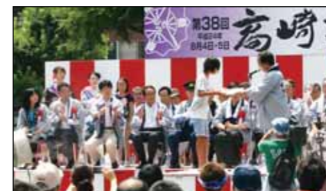
「第38回高崎まつり」の開会式典に出席。町内の山車を拝見し、神輿の詰所などにご挨拶。[2012年8月4日]

後援会にご入会ください! 三宅雪子の政治活動に賛同、応援して下さる方に後援会ご入会をお願いしております。お知り合いの方にも後援会入会をお薦めいただければ幸いです。会費無料。 点線部分でお切りいただき「切手を貼らずに」ポストに投函いただくか、このままFAXで送信ください。Fax.027-323-3890