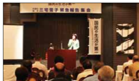
緊急報告集會にて「国民の生活が第一」入党に至る政治行動についてご報告をさせていただきました。[2012年7月28日]