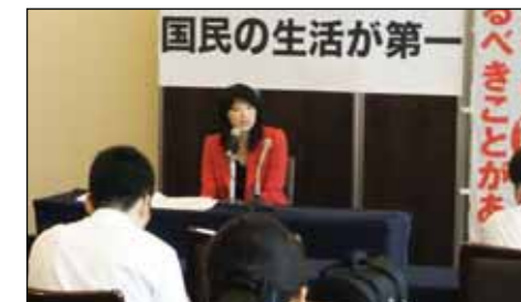
民主党離党、「国民の生活が第一」入党の記者会見をホテルメトロポリタン高崎にて行いました。[2012年7月13日]