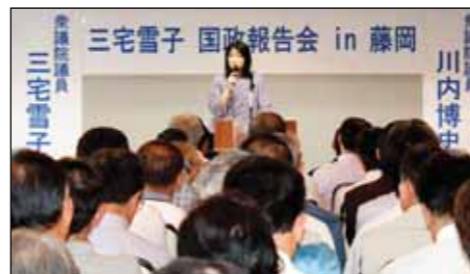
川内博史衆議院議員を講師に消費税・TPP・原発問題を考える「国政報告会 in 藤岡」を開催。[2012年7月1日]